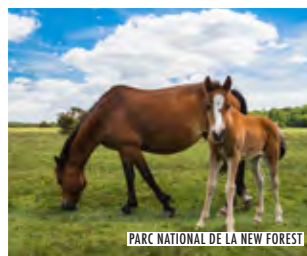
PARC NATIONAL DE LA NEW FOREST

Et n'oubliez pas que Londres se trouve à seulement 90 minutes en train ou en bus. En arrivant aux gares de Waterloo ou de Victoria, vous serez proche du London Eye, de l'Imperial War Museum, de South Bank, de Big Ben ainsi que des nombreuses autres attractions surprenantes.