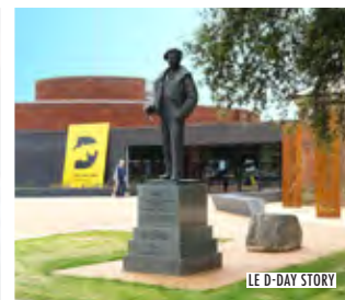
LE D-DAY STORY