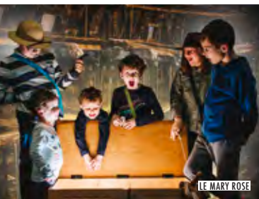
LE MARY ROSE