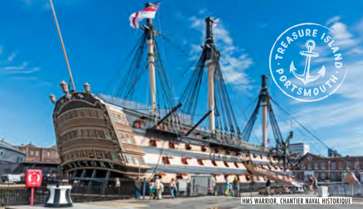
HMS WARRIOR, CHANTIER NAVAL HISTORIQUE