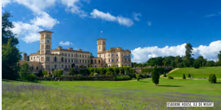
OSBORNE HOUSE, ÎLE DE WIGHT

Renseignements ferroviaires: ☎ +44 (0)84 57 48 49 50