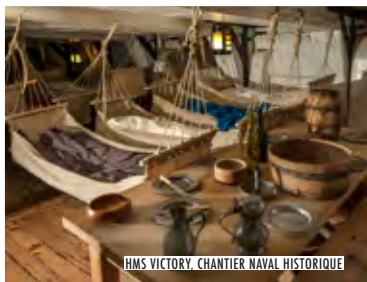
HMS VICTORY, CHANTIER NAVAL HISTORIQUE