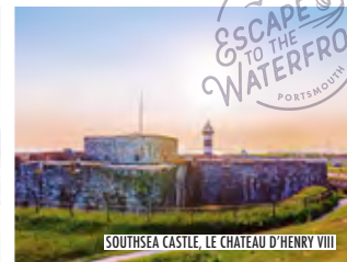
SOUTHSEA CASTLE, LE CHATEAU D'HENRY VIII