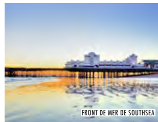
FRONT DE MER DE SOUTHSEA

Musée ouvert tout le long de l'année; les papillons sont visibles d'avril à septembre. www.portsmouthnaturalhistory.co.uk