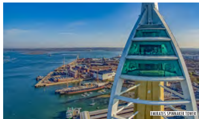
EMIRATES SPINNAKER TOWER

Nouveau: l'arrivée du LCT 7074, une énorme barge de débarquement qui a servi à transporter les tanks en traversant la Manche, sera la visite préalable au musée. www.thedaystory.com