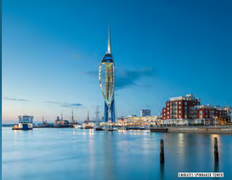
EMIRATES SPINNAKER TOWER